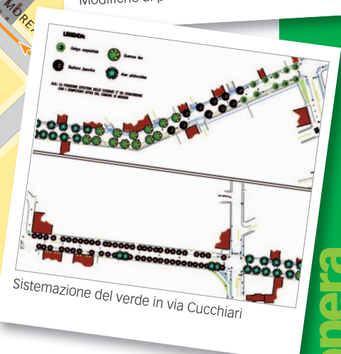
Sistemazione del verde in via Cucchiari