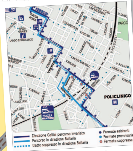
Modifiche al percorso del bus linea 4