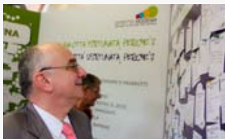
Qui sopra la bacheca allestita in Piazza Grande durante il Festival della Filosofia