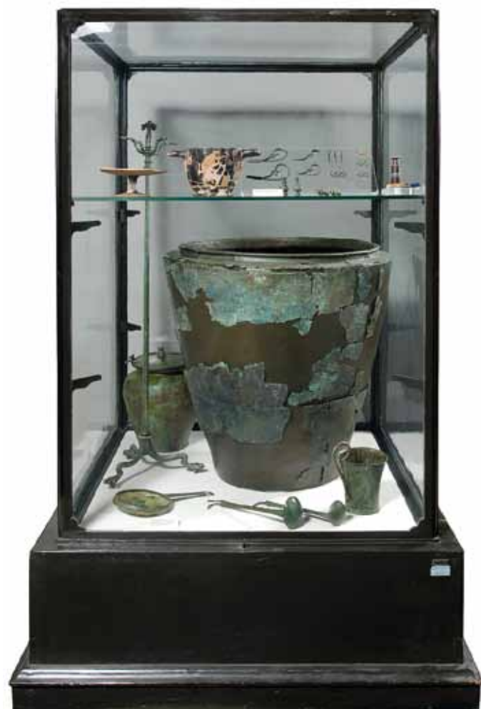
Grande situla-cinerario in bronzo e corredo della tomba 2 della necropoli della Galassina di Castelvetro. V secolo a.C.