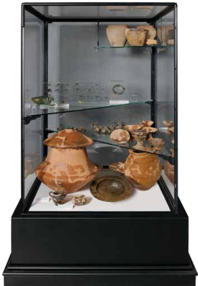
Urna cineraria e corredo femminile. Casinalbo. Inizi VII secolo a.C.

Palazzo dei Musei - viale Vittorio Veneto 5 - Modena www.comune.modena.it/museoarcheologico museo.archeologico@comune.modena.it tel. 059 2033100 - 2033122