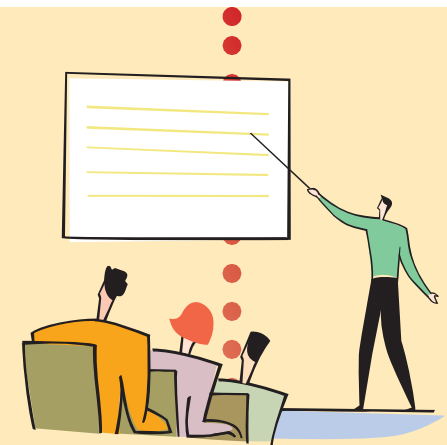
PRESENTAZIONE DEGLI INTERVENTI