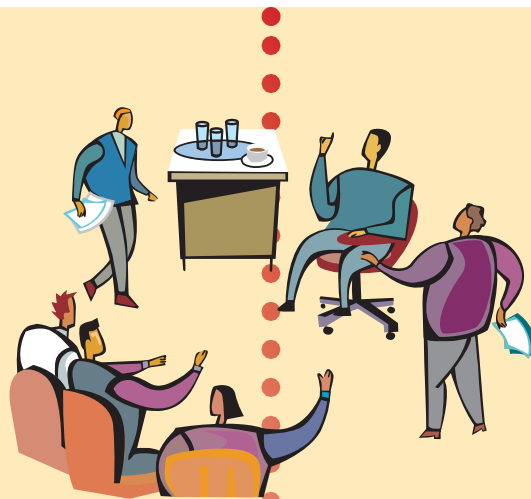
SPAZIO APERTO DI DISCUSSIONE