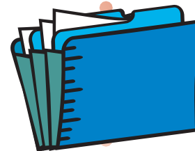
DOCUMENTO DI SINTESI DEGLI INTERVENTI