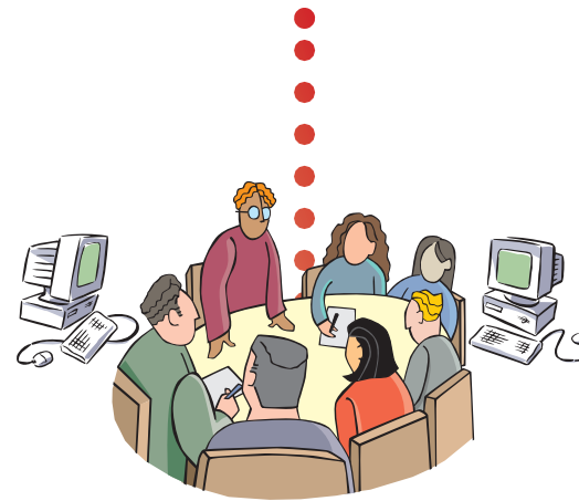
TAVOLI DI CONFRONTO E PROGETTAZIONE