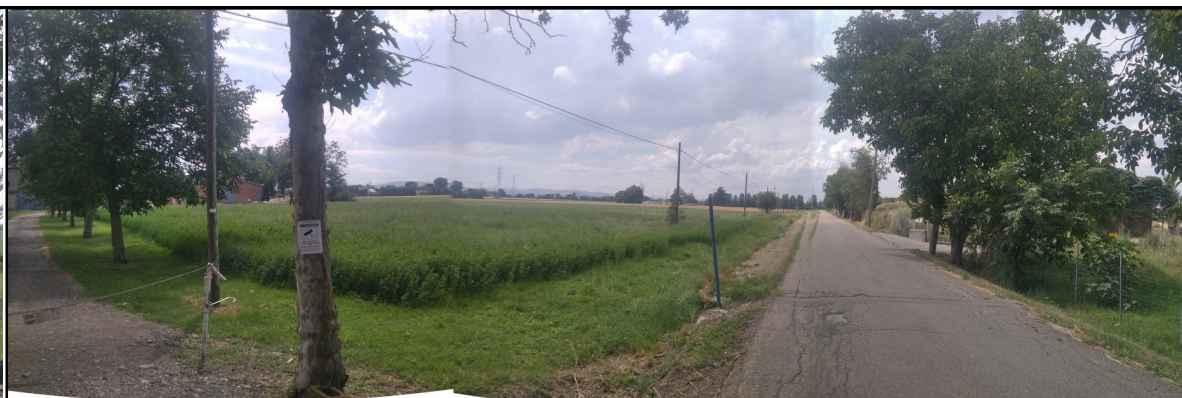
Foto n. 2: Vista dalla carraia di accesso (da intersezione su Strada Pederzona) verso ovest lungo il confine nord ovest dell'area di intervento; sono visibili: sulla destra i sostegni di BT aerei (paralleli alla viabilità), al centro dello scatto lo sviluppo verso ovest della Strada Pederzona, a sinistra i sostegni aerei della linea telefonica interferente. In primo piano un esemplare alberato che costituisce il filare di accesso ai fabbricati rurali; a destra, oltre il gruppo alberato, le aree costituenti le porzioni sud di cava Casa Vecchia (E16) con il relativo accesso.