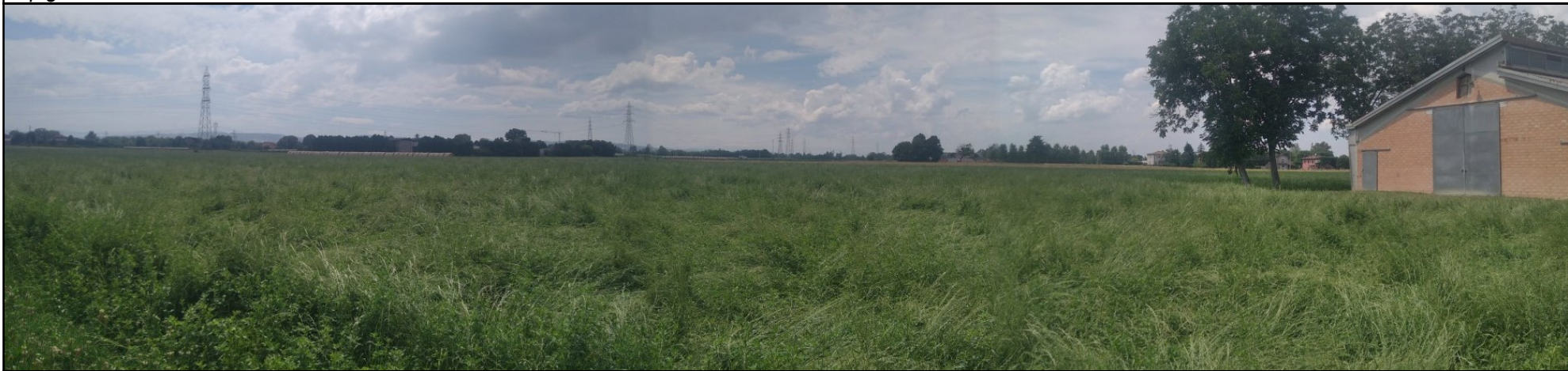
Foto n. 5: Panoramica in direzione ovest dalla zona centrale dell'area di cava a monte dei fabbricati; sono visibili: sulla sinistra in primo piano la zona agricola costituente le porzioni ovest dei lotti di 3, 2 e 1, a destra l'edificio oggetto di futura demolizione con l'avanzamento degli scavi con funzione fienile e ricovero. Sullo sfondo i tralicci delle linee elettriche di alta tensione diffusi in questa parte del territorio ma non presenti all'interno dell'area di cava.