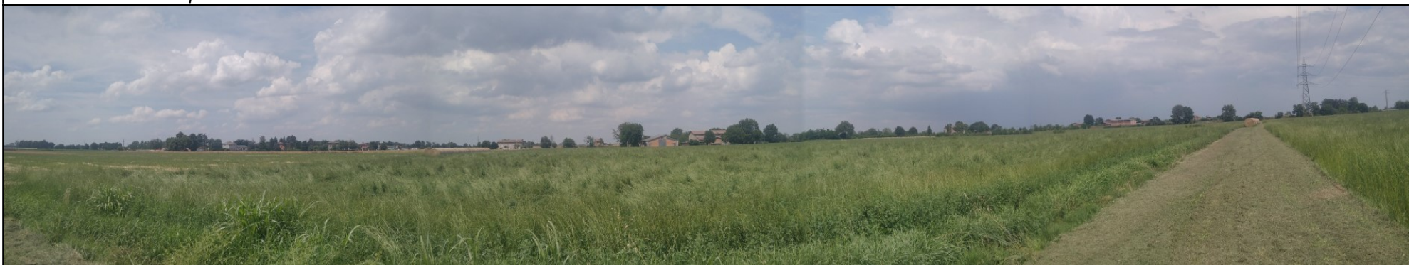
Foto n. 7 Panoramica in direzione nord dalla porzione sud ovest del limite di cava; in primo piano i coltivi insistenti nei lotti di scavo; sullo sfondo, oltre la cortina vegetazionale pertinenziale, i diversi fabbricati oggetto di demolizione con l'avanzamento degli scavi; a sinistra è visibile il traliccio della linea di alta tensione (angolo sud est del limite di intervento) non interferente.