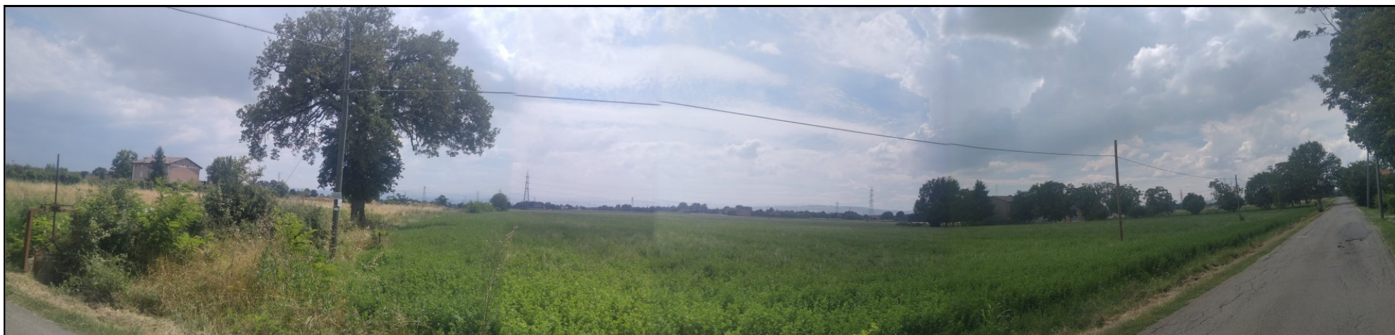
Foto n. 3: Panoramica in direzione sud ovest dallo spigolo nord est dell'area di intervento, ripreso da Strada Pederzona; sono visibili: sulla sinistra il manufatto idraulico (chiusa) posto sul Rio Girola con l'intorno di vegetazione spontanea cresciuta sulle sponde, in primo piano la zona agricola costituente parte dei lotti di scavo 4 e 5, a destra i complessi edilizi (e relativa vegetazione pertinenziale) oggetto di demolizione con l'avanzamento degli scavi. In primo piano a destra Strada Pederzona (verso ovest) parallela al limite di intervento nord con i sostegni Tel e BT rispettivamente a sud e nord della carreggiata.