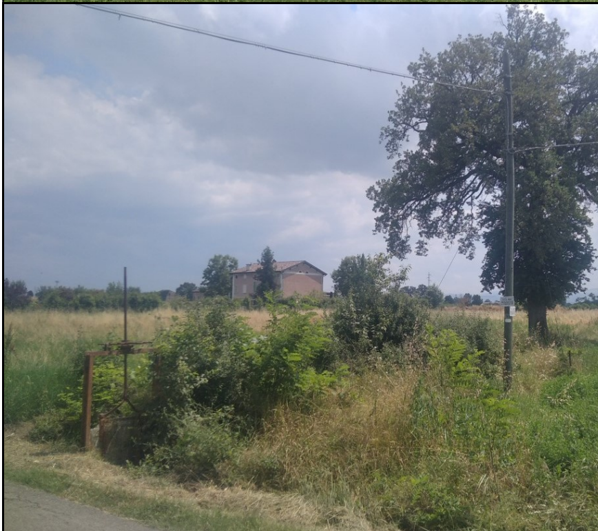
Foto n. 8 sinistra Foto di dettaglio dell'angolo nord est dell'area di intervento; si può notare a sinistra il manufatto idraulico (chiusa) posta sul Rio Ghirola che non sarà interessato dagli interventi in oggetto e a destra la linea telefonica con sostegno interferente e l'attraversamento aereo del cavo sopra Strada Pederzona.

Foto n. 9 sopra Panoramica in direzione nord dalla porzione sud est del limite di cava; in primo piano si può notare la cortina vegetativa a carattere arboreo arbustivo con alcuni esemplari alberati lungo lo sviluppo del Rio Ghirola coincidente con il limite ovest dell'area di intervento. Tale cortina vegetazionale sarà mantenuta e non sarà interessata dagli interventi in progetto rimanendo interna alla fascia di rispetto.