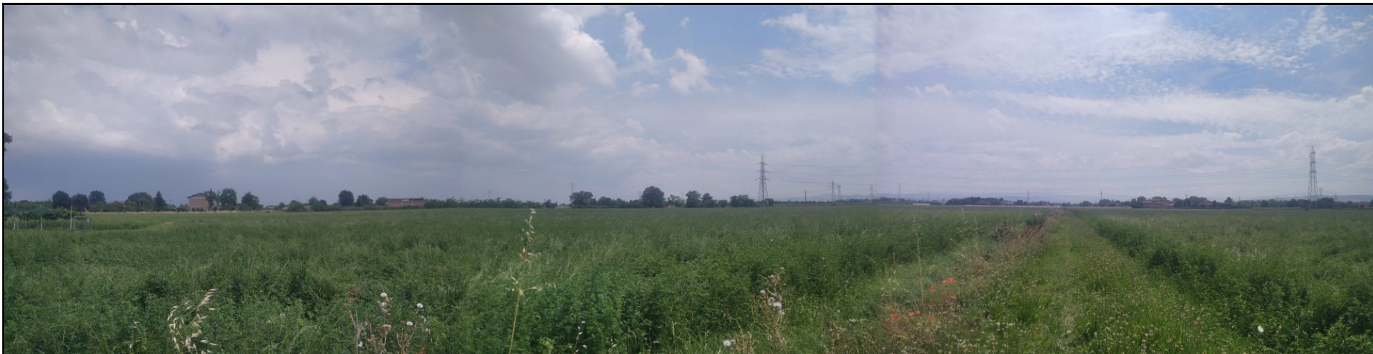
Foto n. 4: Panoramica in direzione sud dalla zona centrale dell'area di cava a monte dei fabbricati; sono visibili: al centro la carraia agricola di pertinenza delle coltivazioni interne all'intervento e a sinistra porzioni est dei lotti di scavo 3, 2 e 1; sullo sfondo l'elettrodotto di alta tensione con i relativi tralicci, in prossimità degli spigoli sud-est e sud ovest dell'intervento.