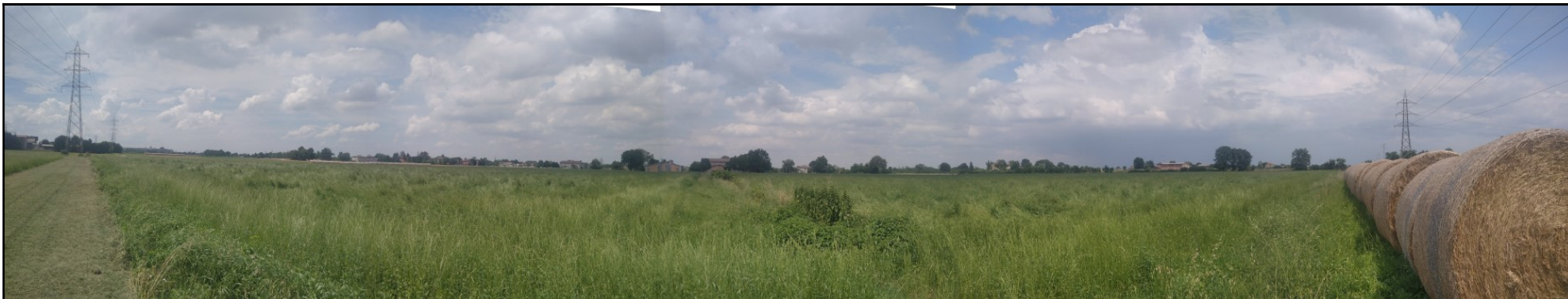
Foto n. 6: Panoramica in direzione nord dalla porzione sud est del limite di cava; in primo piano i coltivi insistenti sui lotto di scavo; sullo sfondo, oltre la cortina vegetazionale pertinenziale, i diversi fabbricati oggetto di demolizione con l'avanzamento degli scavi; a destra e sinistra sono visibili i tralicci della linea di alta tensione (angoli sud est e sud ovest del limite di intervento). La fascia di rispetto di 20 m del traliccio sud est risulta non interferente con l'area di intervento mentre la medesima del traliccio sud ovest interessa parzialmente aree ricomprese nell'intervento; in quest'ultimo caso gli scavi si manterranno ad una distanza di 20 m dalla base del traliccio in questione.