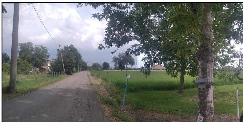
Foto n. 1: Vista dalla carraia di accesso (da intersezione su Strada Pederzona) verso est lungo il confine nord est dell'area di intervento; sono visibili: sulla sinistra i sostegni di BT aerei (paralleli alla viabilità), al centro dello scatto lo sviluppo verso est della Strada Pederzona, appena a sinistra il marcatore dell'acquedotto civile e oltre i sostegni aerei della linea telefonica interferente. In primo piano un esemplare alberato che costituisce il filare di accesso ai fabbricati rurali.