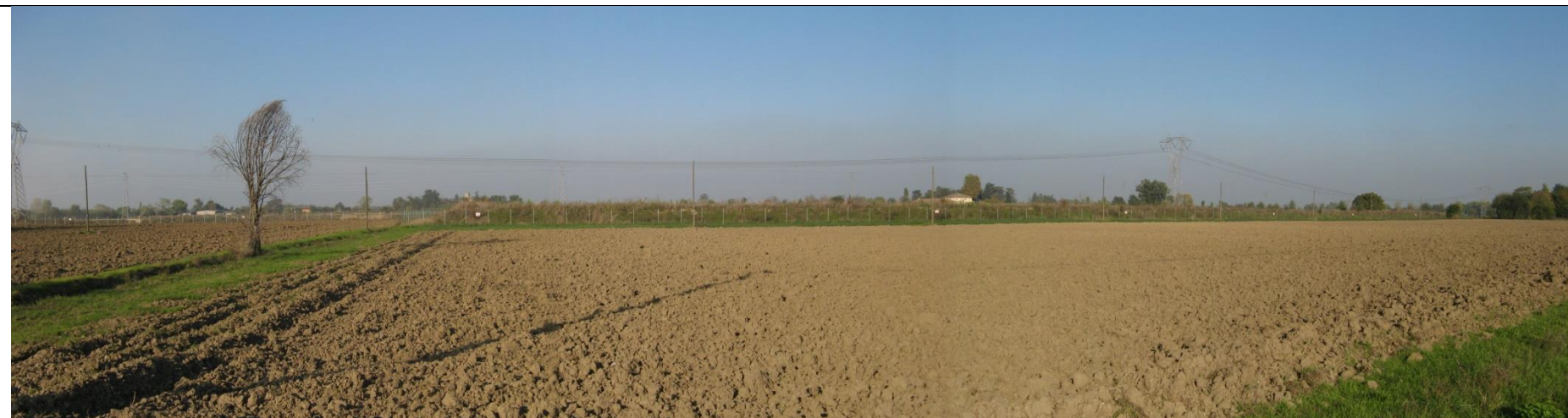
Figura 2: Vista da sud del confine sud della cava "Area I12", sullo sfondo si nota l'argine di mitigazione posto a protezione della precedente fase estrattiva unitamente alla recinzione, allestita coi cartelli monitori ogni 40 m. Sono visibili i sostegni della linea telefonica interferente con gli scavi, nei confronti della quale sarà necessario chiedere l'avvicinamento in deroga alle distanze di sicurezza.