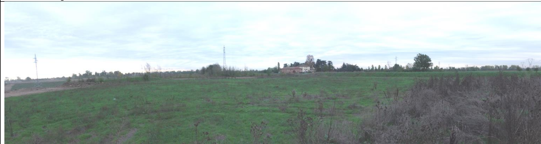
Figura 5: Vista da sud della porzione settentrionale della cava "Area I12" a confine con la cava "Area I10"; sulla destra cumulo di terreno con vegetazione spontanea. Sullo sfondo al centro la località Casino Forgieri; sulla destra l'argine di mitigazione in essere posto sul confine orientale dell'area di intervento.