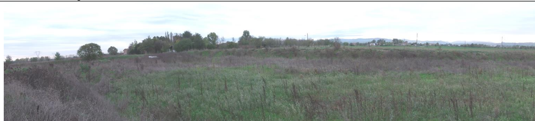
Figura 3: Vista dell'angolo sud-est della cava "Area I12". In primo piano cumuli di cappellaccio con vegetazione spontanea, relativi all'esercizio della cava Gazzuoli-Mo, esercita dalla stessa Betonrossi S.p.A.; lungo il perimetro di cava si nota l'argine di mitigazione già presente su tutto il perimetro della cava "Area I12", che verrà mantenuto anche con l'avanzamento degli scavi. Al centro, sullo sfondo, la proprietà "Bonacini-Muratori", adiacente a Via Gazzuoli, protetta da una matura coltre vegetazionale