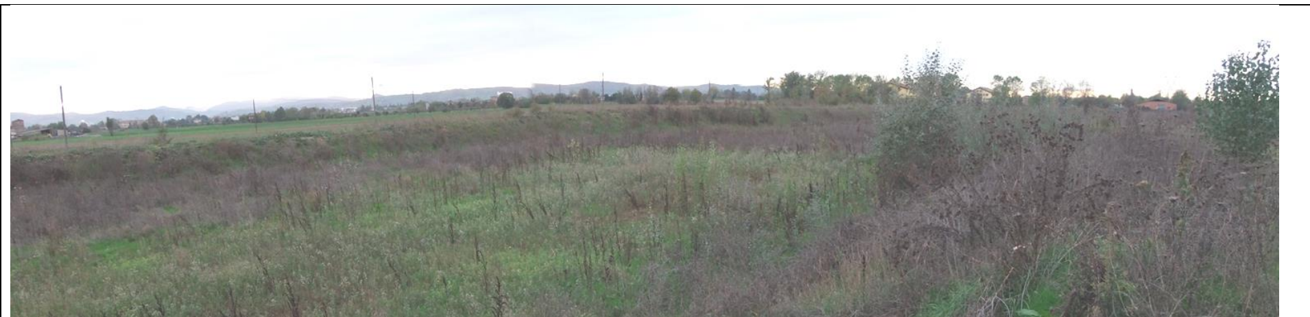
Figura 4: Vista dell'angolo sud-ovest della cava "Area I12". Sulla destra un cumulo di cappellaccio con vegetazione spontanea relativi alla cava Gazzuoli-Mo, esercita dalla stessa Betonrossi S.p.A.; lungo il perimetro di cava si nota l'argine di mitigazione già presente su tutto il perimetro dell'area I12, che verrà mantenuto anche con l'avanzamento degli scavi.