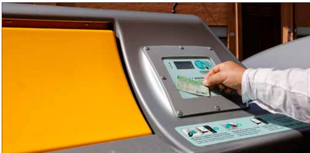
In foto, apertura di cassonetto a supporto della raccolta porta a porta, attivabile esclusivamente con Carta Smeraldo. In basso, il termovalorizzatore di via Cavazza

A determinare la quota annua dei conferimenti è il numero dei componenti del nucleo familiare. Per la calotta stradale da 30 litri (del cassonetto per l'indifferenziato) il regolamento prevede 20 conferimenti per nuclei con un componente, 28 per quelli con due, 32 per tre, 36 per quattro e 40 per nuclei con cinque e più componenti. Ogni conferimento aggiuntivo costerà 1.65 euro.