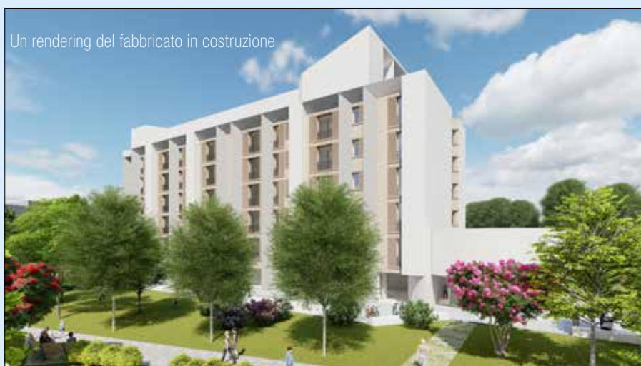
Un rendering del fabbricato in costruzione

Dal primo al 30 settembre 2025 sarà possibile partecipare al bando per l'assegnazione di alloggi del fabbricato di nuova costruzione in via Nonantolana a Modena: una doppia palazzina di 48 alloggi di Edilizia residenziale sociale (Ers), uno dei progetti previsti nel Pinqua, Programma innovativo nazionale qualità dell'abitare, finanziato con fondi Pnrr. Nello specifico, per la realizzazione del fabbricato viene utilizzata un'area già in precedenza edificata, ora recuperata e riconsegnata ai cittadini. L'intervento, del valore complessivo di 10 milioni 344 mila euro, è finanziato per 3 milioni 614 mila euro con risorse assegnate dal Pinqua, per 2 milioni 100 mila euro dal Fondo opere indifferibili Pnrr e per 1 milione dalla Regione Emilia-Romagna nell'ambito del Piers. Ulteriori 3 milioni 614 mila euro sono a carico della cooperativa Unicapi, soggetto selezionato tramite avviso pubblico che gestisce gli alloggi, mentre circa 15 mila euro sono in autofinanziamento del Comune.