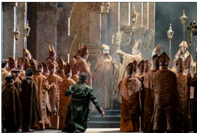
Nelle foto, "Tosca" al Teatro del Giglio di Lucca, "I quattro rusteghi" e "Pinocchio"

Sul fronte concertistico, la stagione si