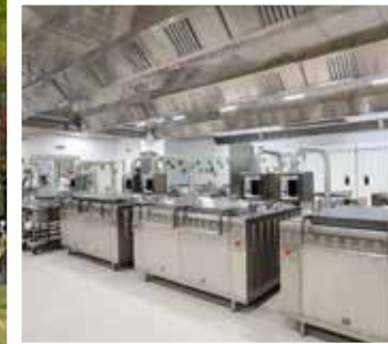
Nella foto di repertorio il rientro in classe degli studenti della Scuola Primaria "Cittadella". In alto, un dettaglio del nuovo Centro pasti

A verifica della qualità del servizio ci sono commissioni mensa attive in tutti gli ordini scolastici e un sistema di monitoraggio continuo, anche tramite l'app Cirfood "Menù Chiaro", con cui le famiglie possono seguire quotidianamente cosa viene servito a scuola.