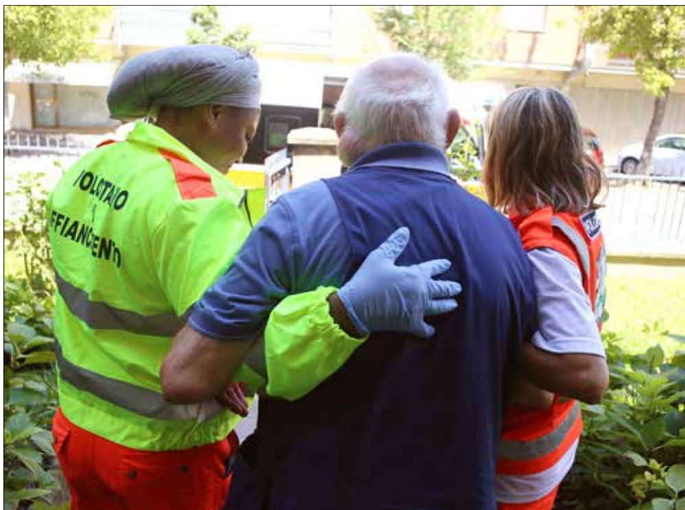
Nella foto di repertorio, una migrante richiedente asilo in affiancamento con i volontari della Croce Blu, durante un corso di volontariato organizzato in collaborazione con la cooperativa sociale Caleidos