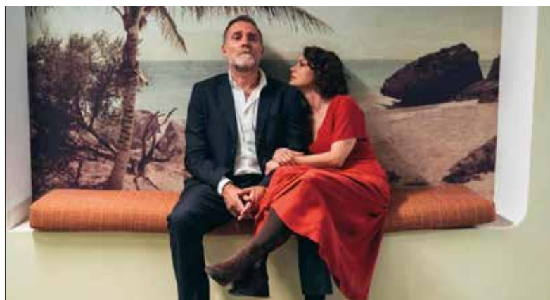
Nelle immagini, l'Arena del SuperCinema estivo e alcuni fotogrammi del film "Nonostante" (Valerio Mastrandrea, 2024) e "La grande ambizione" (Andrea Segre, 2024)