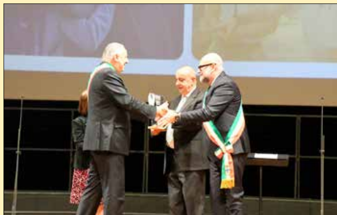
Un momento del passaggio di testimone nel capoluogo siciliano