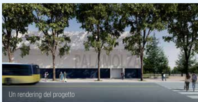
Un rendering del progetto

L'intervento, che segue i lavori di rinnovo del padiglione B, prevede la riqualificazione architettonica e l'efficientamento energetico del padiglione A, il