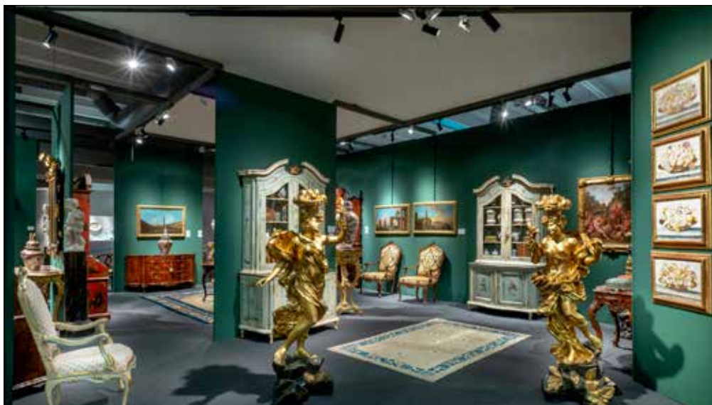
Alcune foto di repertorio della rassegna Modenantiquaria. Quest'anno trentanovesima edizione

Attorno all'evento prende forma una rete di collaborazioni con il territorio: strutture ricettive che propongono condizioni agevolate per i visitatori, itinerari culturali ed enogastronomici dedicati, valorizzazione delle eccellenze locali anche all'interno dei padiglioni fieristici. Tra i momenti di maggiore richiamo, la "mostra nella mostra" Ritratto tra Sacro e Profano, con dipinti, sculture, disegni