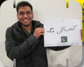
Zia (Costa d'Avorio)

In molti piccoli paesi non ci sono le librerie e i libri non ci sono in molte case. Io non ho mai visto un libro nella mia casa. Ho iniziato a vederli in Italia. Zia (Afghanistan)