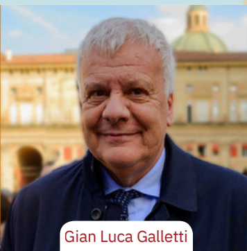
Gian Luca Galletti