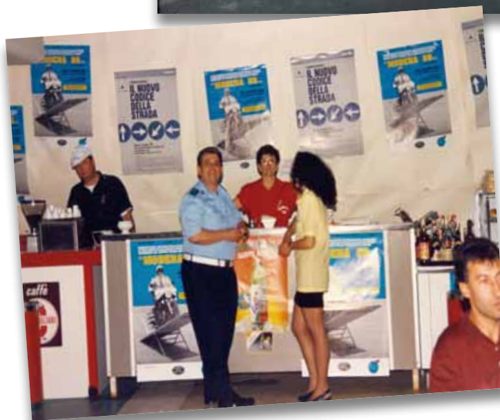
Modena 88, Copertina del depliant illustrativo, 1988, Collezione privata Bertacchini

Alle occasioni sportive si affianca, in tutte le edizioni, l'attività di un punto di ristoro in cui convergono durante le pause atleti, accompagnatori e cittadini.