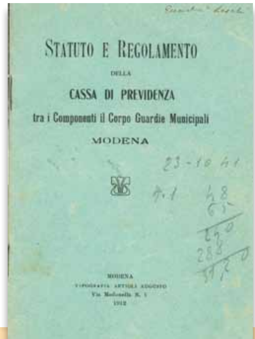
Statuto e Regolamento del Fondo, 1912, 1929, Archivio Polizia Municipale

Nel 1923 lo Statuto viene aggiornato limitando lo scopo della cassa stessa: mentre lo statuto del 1912 estende i benefici alle Guardie Municipali, quello del 1923 lo limita ai Vigili stabili o assunti con carattere di stabilità. Viene inoltre introdotta nel Consiglio la presenza di due revisori dei conti e il fondo viene rimpinguato con tutte le "regalie o premi in danaro che fossero dati al Corpo o ai singoli componenti". Ulteriori modifiche vengono apportate nel 1929 quando è previsto un tetto massimo di Lire 300 per i sussidi concessi per causa di malattie o di morte e viene riscritto l'art. 13 che modifica il calcolo del rimborso dovuto all'iscritto che "per ragioni di interesse particolare dovesse passare ad altro servizio privato o alle dipendenze del comune, cessa immediatamente di partecipare al dividendo delle diverse indennità ed avrà diritto al rimborso di tutto il fondo a lui spettante" parametrandolo alla "durata del servizio prestato e dell'utile dato alla cassa."