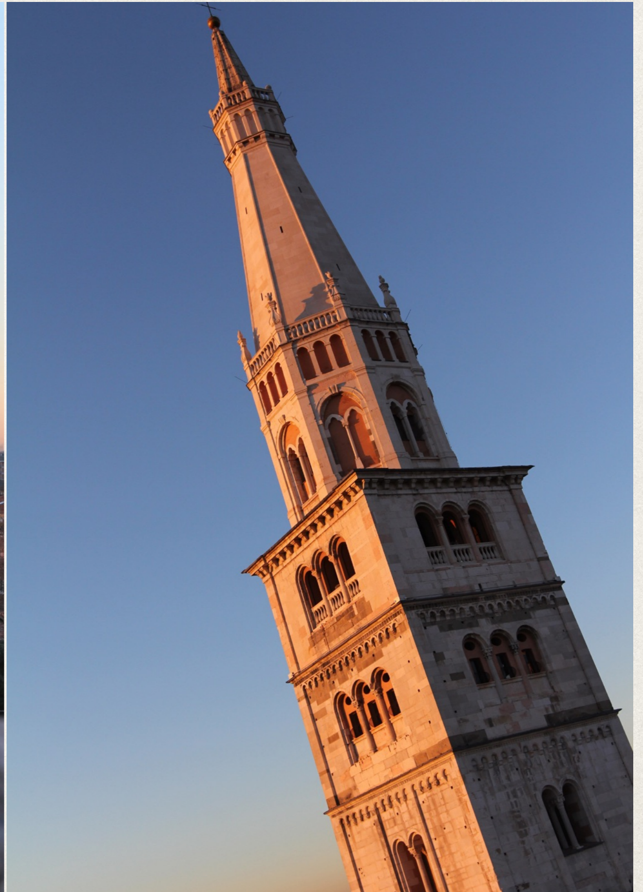
Vista di Modena da Palazzo Comunale e della Ghirlandina