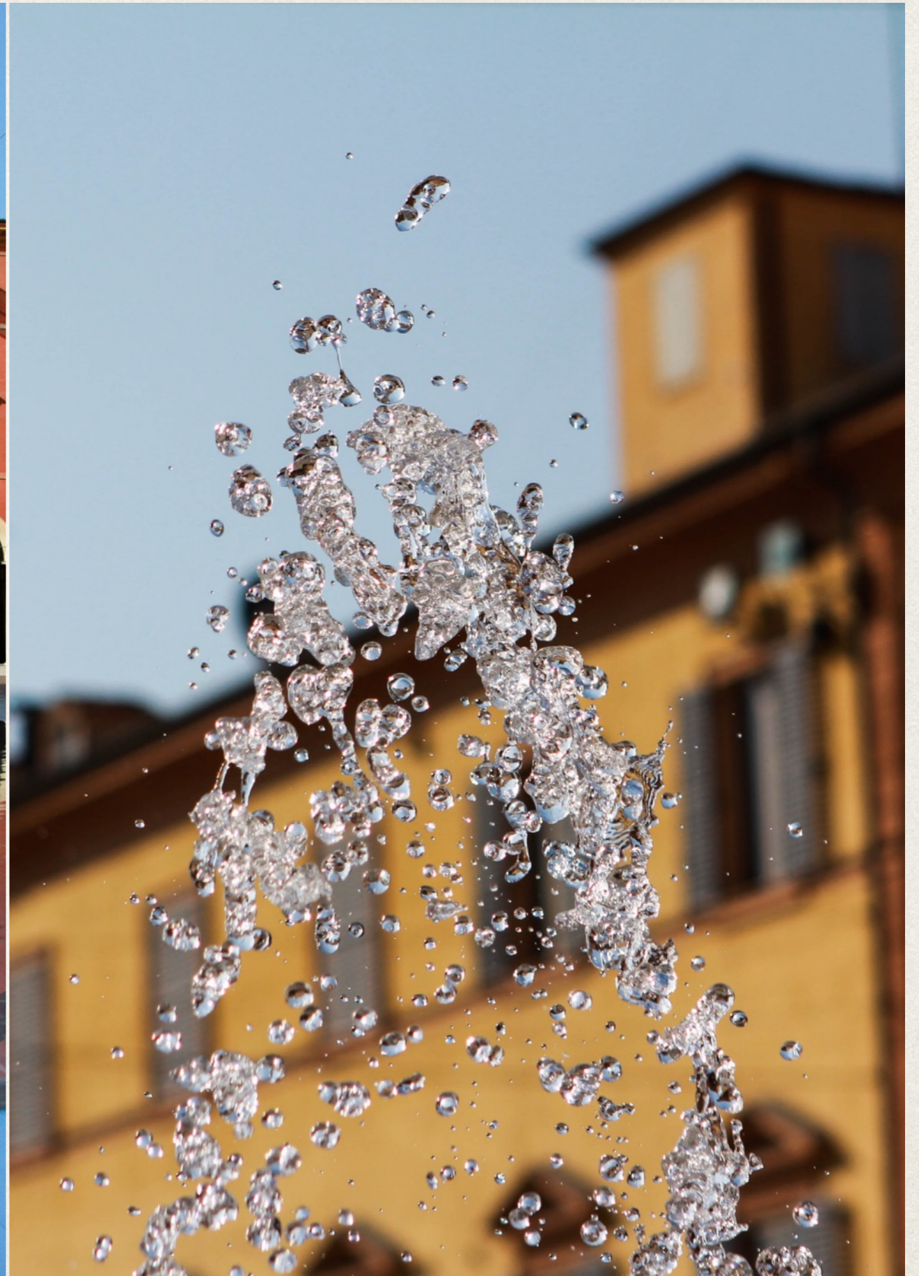
Piazza Roma, Modena