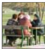
In cinque anni sono state centinaia le iniziative e i progetti proposti e realizzati dalle Circoscrizioni

Gli sportelli anagrafici consentono di effettuare certificazioni (cittadinanza, residenza, stati di famiglia, ecc.), autentiche e dichiarazioni sostitutive di atto notorio. Si possono fare inoltre carte d'identità e licenze di pesca.