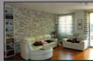
451 INTERNO MORANE/CONTRADA

Abitazione ind.Te di mq. 165 (4 Letto, 2 bagni) con ampio giardino alberato, terrazzo mq. 75, Garage mq. 40.