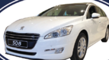
PEUGEOT 508 sw 2.000 HDI 163cv - BUSINESS - automatica anno 2012 - garanzia ufficiale Peugeot - da euro 19.500*