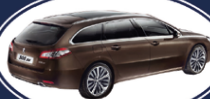
PEUGEOT 508 sw 2.000 HDI 140/163cv - ACTIVE/ALLURE anno 2012 - garanzia ufficiale Peugeot - da euro 17.500*