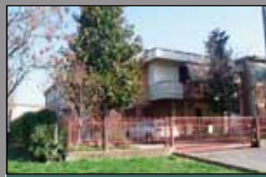
416 BAGGIOVARA/ZONA CHIESA

Abitazione ind.Te di mq. 165 (4 Letto, 2 bagni) con ampio giardino alberato, terrazzo mq. 75, Garage mq. 40.