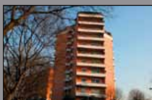
432 VIA CARLO SIGONIO

In signorile borgo finemente recuperato, ultima nuova villa d'angolo con giardino attrezzato piantumato di circa mq. 1.000, ampio garage e posti auto.