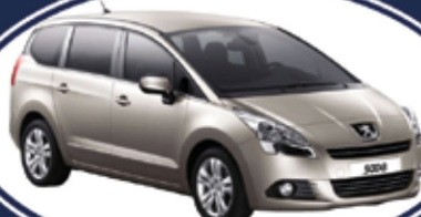
PEUGEOT 5008 1.600 HDI 112cv - ACTIVE - anno 2012 garanzia ufficiale Peugeot - da euro 15.900*