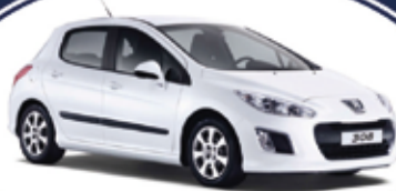
PEUGEOT 308 1.600 HDI - 5 pt. - anno 2011-2012 garanzia ufficiale Peugeot - da euro 11.900*