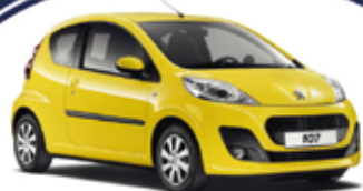
PEUGEOT 107 1.000cc - 5 pt. - anno 2011-2012 omologata neopatentati - da euro 6.900*

Via Emilia Est, 814 41125 Modena Showroom tel. 059 2930311 Assistenza tel. 059 2930328 Magazzino ricambi tel. 059 374407 modena@nuova-autofrance.it