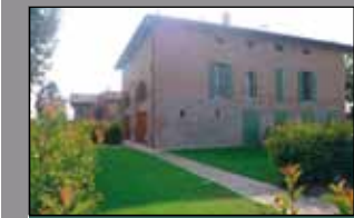
169 MODENA SUD

In ottima posizione residenziale, villa indipendente su terreno di 1240 mq, con ampi spazi abitativi e di servizio.