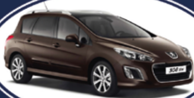
PEUGEOT 308 sw 1.600 HDI 112cv - ACTIVE - start & stop anno 2012 - garanzia ufficiale Peugeot - euro 13.500*