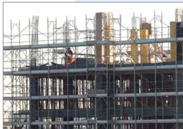
Sopra, Nicola Gratteri parla in Consiglio comunale di fianco alla presidente Caterina Liotti e al sindaco Giorgio Pighi; sotto, immagine di un cantiere. Tra le richieste del consiglio anche maggiori controlli

cket e dell'usura, così come al sostegno delle realtà associative assegnatarie di immobili confiscati alla criminalità organizzata”. Tra le richieste anche quella di attivare una “campagna d'informazione rivolta alla cittadinanza contro il racket e l'usura e gli strumenti legislativi esistenti per chi denuncia i propri estorsori e usurai”.