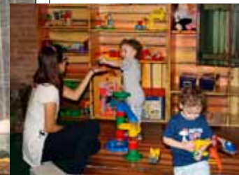
Foto di gruppo per una classe di formazione del Servizio civile straordinario, davanti al Duomo di Carpi danneggiato dal sisma. A destra, volontaria con bambini.

territoriali, l'essere riusciti a concretizzare il bando e a farlo partire in pochi mesi è un risultato importante".