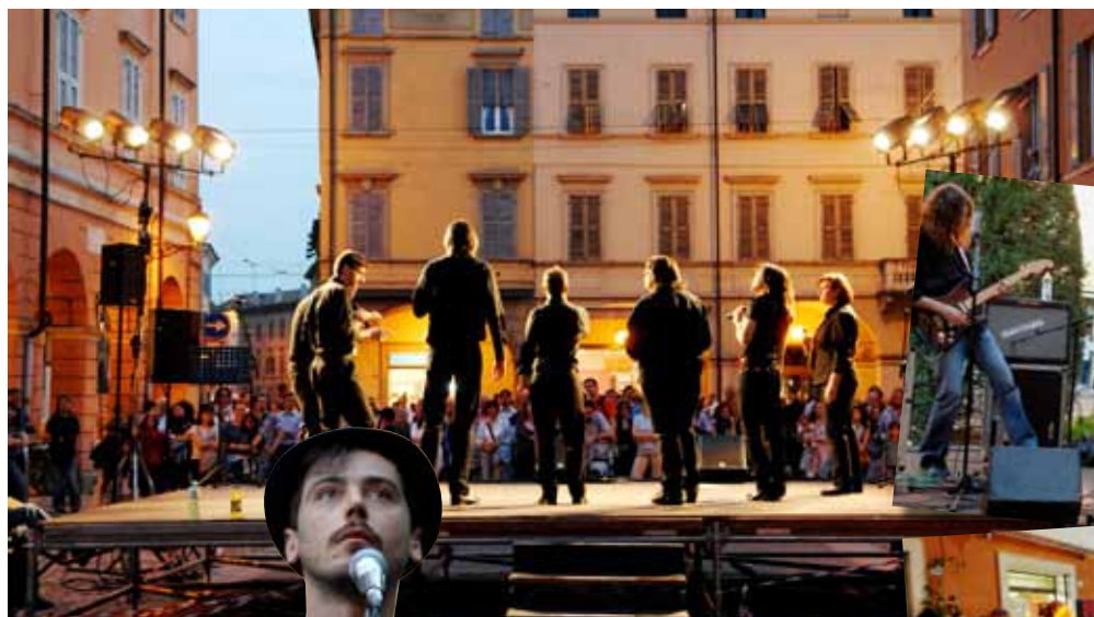
Esibizioni musicali in centro. Sotto, il logo della manifestazione