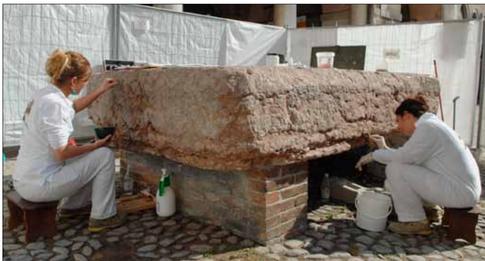
Restauratrici all'opera sulla "Preda ringadora" in piazza Grande

P er chi non la conosce, all'apparenza è un blocco di pietra naturale senza decorazioni. Ma per i modenesi la "Preda ringadora" è un monumento di grande valore affettivo, che dal Medioevo ha avuto un ruolo centrale nella vita collettiva. Il suo uso e la sua collocazione in piazza Grande, all'aperto per sette secoli pressoché ininterrotti, l'hanno esposta a usura e degrado, e ha avuto bisogno per questo di un intervento di restauro. È stato il Lions Club Modena Estense a mettere a disposizione del Comune la cifra necessaria per i lavori alla "Preda", mentre lo studio preliminare al restauro è stato eseguito dai tecnici del Comune insieme con una equipe del dipartimento di Scienze della Terra dell'Università. Il blocco di pietra rossa è lungo circa tre metri. Durante il Medioevo veniva utilizzata come palco per i banditori, che notificavano al popolo le grida dei decreti, e per gli oratori che tenevano comizi e arringavano la folla. Proprio da qui il nome "ringadora", che in dialetto modenese significa appunto "Pietra dell'Arringa". Su di essa venivano poi messi alla gogna i debitori e i truffatori, oppure vi si esponevano i cadaveri di annegati per poter essere identificati. Era usata anche come pietra del disonore: secondo quanto emerge dall'Archivio Storico Comunale ogni debitore insolvente, dopo aver fatto il giro della piazza con la testa rasata e uno speciale copricapo, era costretto a "dare a culo nudo suso la