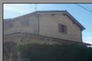
440 MO EST/FOSSALTA

Modena - Via Imola 90/b - 059 392903 www.immobiliarecapital.net