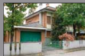
399 MODENA EST AD.ZE CONAD

Villa di testa con giardino di mq. 250, composta da piano seminterrato, piano rialzato zona giorno e piano primo zona notte. Ottime finiture, faccia vista anticata, tetto in legno a vista, aria condizionata. Al seminterrato possibile soluzione bifamiliare di ca mq. 60. € 520.000.