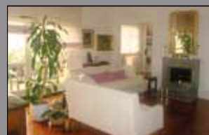
441 S.FAUSTINO/VILL. GIARDINO

A pochi km da Modena, in signorile borgo recuperato, nuova villa d'angolo con caratteristiche finiture in contrasto moderno / rurale. Zona giorno affacciata su ampio giardino attrezzato. Quattro camere, quattro bagni, garage. Poss. tà soluzione bifamiliare in luminoso mansardato. € 440.000.