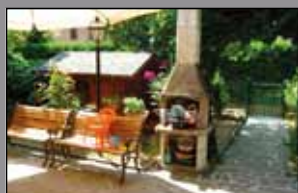
479 MORANE/ ZONA REGIONI

Modena - Via Imola 90/b - 059 392903 www.immobiliarecapital.net