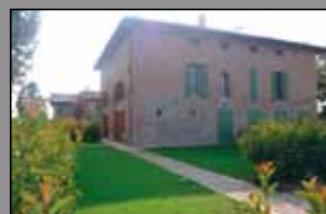
169 MODENA SUD

In villa d'epoca del '700 completamente restaurata, appartamenti varie metrature con garage e posto auto. Un alloggio con ingresso indipendente e ampio giardino. Soluzioni con una, due e tre camere da letto. Ampia villa adiacente mq. 350 con giardino di ca. mq. 800.