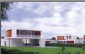
271 INT. VIA CONTRADA/IPPODROMO

Attico signorile di mq. 180 con splendido terrazzo attrezzato, ampia zona giorno, cucina abitabile, due letto, due bagni, ampia lavanderia/rip., due garage. Finiture e impiantistica all'avanguardia, arredi su misura.