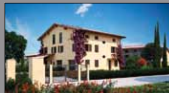
175 LEVIZZANO DI CASTELVETRO

Palazzetto indipendente con doppio ingresso di mq. 280 disposta su due livelli più taverna, solaio e terrazzo, completamente restaurata con finiture di lusso. Travi a vista, camino, garage doppio. Possibilità di comoda soluzione bifamiliare. € 380.000.