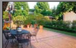
129 COGNENTO CENTRO

In signorile borgo in fase di completa ristrutturazione, porzioni di rustico con giardino e ville singole. Finiture signorili personalizzabili. Splendida posizione con vista mozzafiato.