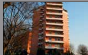
432 VIA CARLO SIGONIO

App.to di ampie dimensioni al pt c/ giard. di 200 m 2 ca. Ingresso, salone, tinello e cucina, 3 camere, 2 bagni, taverna con bagno, cantina, garage e lavanderia. Poss. tà di altro ampio app.to sovrastante con 3 letto più studio, 3 servizi, ottime finiture. Poss. tà di soluzione bifamiliare. € 420.000.