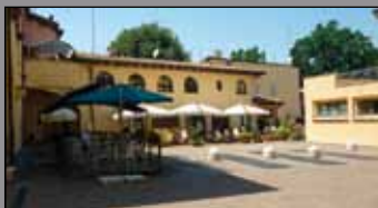
452 CASTELNUOVO R./CENTRO STORICO

In zona residenziale e immersa nel verde, disponiamo di area di oltre mq. 7.000 con possibilità di frazionamento e di ricavare 2/3 ville indipendenti di varia metratura e tipologia, possibilità progetto personalizzato. Vendita area, ville al grezzo o finite.