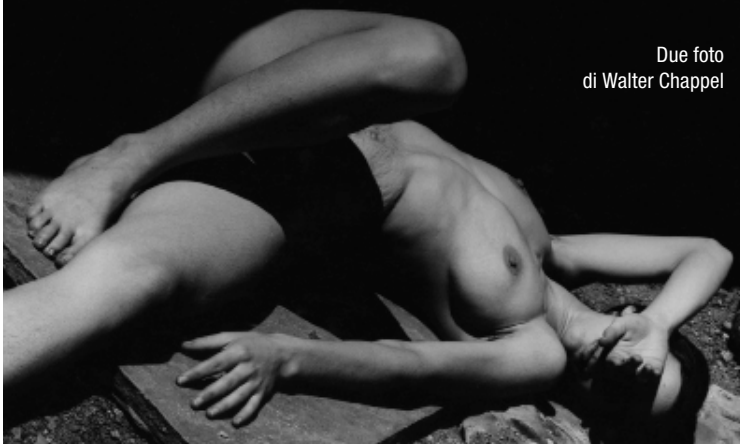
Due foto di Walter Chappel

all'amore, tutte descritte in anteprima sul sito nella sezione "programma creativo". È particolarmente ricca l'offerta dell'ex Ospedale Sant'Agostino, con le tre esposizioni della Fondazione Fotografia Modena. "Eternal Impermanence" è una retrospettiva dedicata a Walter Chappel (1925 - 2000), a cura di Filippo Maggia: si tratta di uno dei protagonisti più controversi della fotografia americana del XX secolo, la cui opera, intensamente provocatoria, è rimasta a lungo celata. Mosso da una vivace curiosità e da una spinta rivolta all'avanguardia, Chappel indaga con la fotografia i rapporti fra i viventi, le multiformi creazioni della natura, all'insegna della celebrazione dell'amore come energia trasformatrice che regola il cosmo.