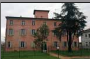
442 SAN DAMASO

In strada chiusa fronte parco, ampia villa schiera con giardino privato, doppio garage e comoda mansarda. € 530.000.