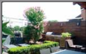
336 ZONA CONTRADA/VACIGLIO

Recente signorile attico su un piano di mq. 190 (3/4 letto, 3 bagni e lav.) terrazzi mq. 70, garage per tre auto. Riscaldamento e condizionamento autonomi, allarme, splendide finiture.