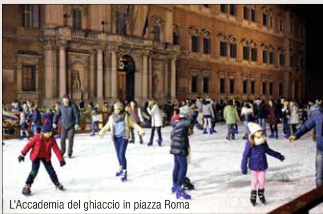
L'Accademia del ghiaccio in piazza Roma

M odenamoremio insieme ai commercianti associati rinnova il suo impegno per fare più belle le atmosfere del centro con iniziative, arredi e luci, col patrocinio del Comune e il sostegno degli sponsor. L'accensione delle luminarie e la collocazione - in piazza Roma, piazza Grande e XX settembre - di tre grandi abeti concessi dal Comune di Fanano hanno dato il via alla magia natalizia nel cuore cittadino. Torna l' Accademia del ghiaccio in piazza Roma, per pattinare e divertirsi. Fino al 23 dicembre da lunedì a giovedì la pista apre dalle 15 alle 19.30; venerdì dalle 15 alle 22 e il weekend dalle 10 alle 12.30 e dalle 15 alle 22. Dopo il 23 dicembre apre dalle 10 alle 12.30 e dalle 15 alle 23, ma nel cuore delle festività gli orari cambiano: il 24 dicembre 15