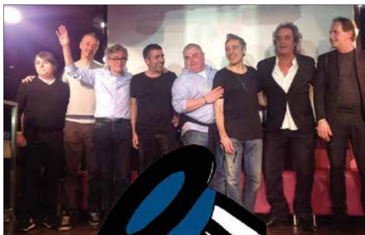
Sopra in senso orario: la sede storica del Picchio Rosso a Formigine; Vasco Rossi e Antoine con un amico; il dream team dei Dj oggi. Sotto: il simbolo del Picchio Rosso