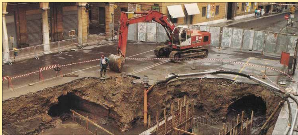
Rifacimento della rete fognaria nel centro storico, nella zona di largo San Giorgio, negli anni Novanta. Ben visibile la rete dei canali storici coperti

I tratti di canale tombati sono gestiti da Hera, mentre per la qualità delle acque l'ente competente è Arpa che, nel territorio comunale, monitora secondo precisi parametri chimici, fisici e biologici in maniera sistematica il Canale Naviglio, in quanto recettore unico dello scarico del depuratore principale, mentre i controlli sui canali minori vengono effettuati solo a seguito di segnalazione di inquinamento. "Non abbiamo informazioni di rinvenimenti di sostanze nocive per la salute umana", ha affermato l'assessore precisando che "le eventuali criticità che si possono verificare sono fondamentalmente di tipo idraulico, in corrispondenza di eventi meteorologici caratterizzati da forte intensità e breve durata, che a volte comportano fenomeni circoscritti di allagamenti stradali". Situazione che migliorerà con la conclusione dell'intervento sul Diversivo Martiniana grazie alla diminuzione delle portate in transito nel centro cittadino.