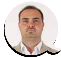
Piergiulio Giacobazzi (Forza Italia)