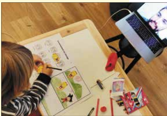
Un bambino impegnato a casa con un laboratorio online di Fmav

Ai giovani sono dedicate le mostre in pillole nell'ambito del format #fmavinsideout che accompagna-