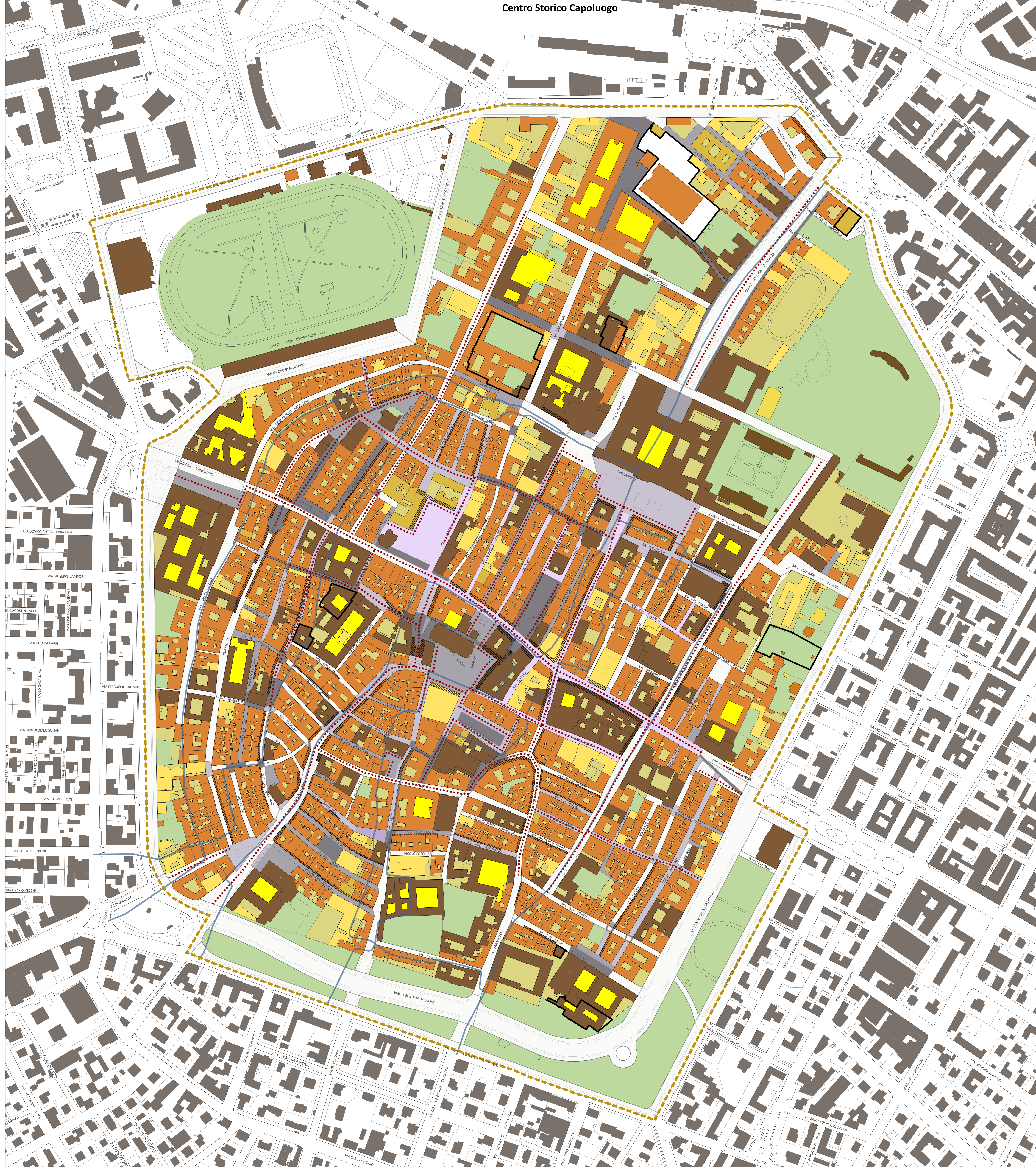
Centro Storico Capoluogo