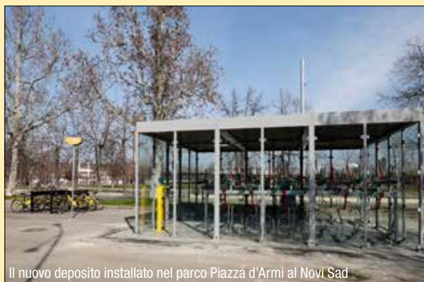
Il nuovo deposito installato nel parco Piazza d'Armi al Novi Sad

Finanziato dal ministero con risorse Pnrr potenzia i servizi di ciclabilità del Comune