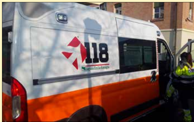
Nella foto, un mezzo del Servizio territoriale del 118 Modena